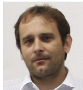
Autor: Ing. Radovan Tiňo, PhD. Fakulta chemickej a potravinárskej technológie STU v Bratislave

Projekt 7. RP EU DuraWood, zameraný na ochranu dreva v exteriéri pomocou vodných náterových systémov, možno aplikovať účinkom plazmy na povrch dreva. Do riešenia sa zapojili tri výskumné organizácie a štyri malé a stredné firmy z krajín EÚ: Španielska, Nemecka, Slovenska a Českej republiky.